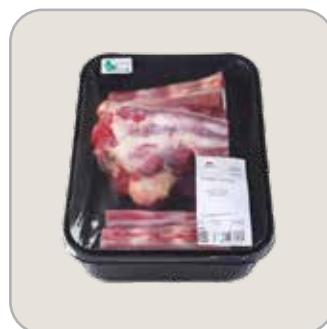
Plate Côte Boeuf A/Os