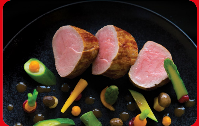
8661 Mignon de veau