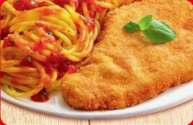
7929 Escalopes Veau XXL