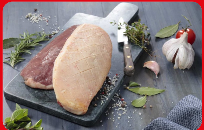
9159 Magret de Canard France ( Frais/CG)