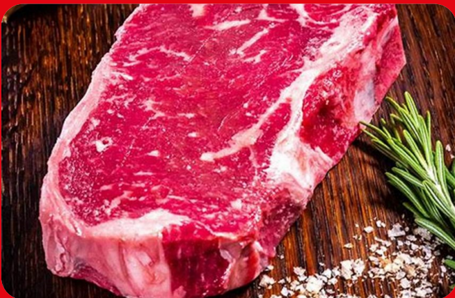
8480 Entrecôte de Bœuf LUX